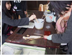
塗装体験 コースター作成