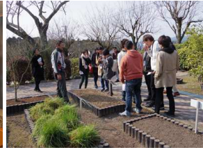
薬用植物園の見学