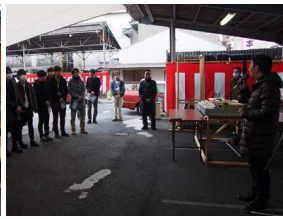
小松教授による総評