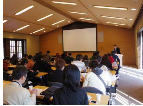
東華菜館 于社長による説明