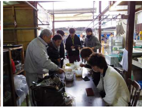
妹尾会長による説明