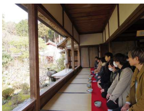
お茶とお菓子を頂く