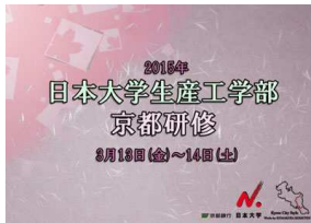
京都研修のロゴマーク