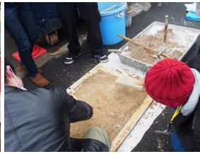
三和土(たたき)体験