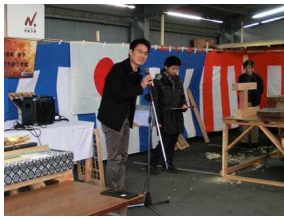
京都銀行 江口支店長代理 挨拶