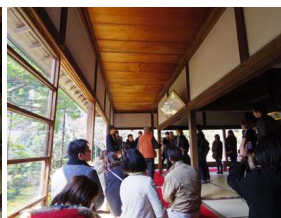
血のり天井の説明