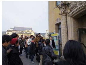
玄関アプローチの説明