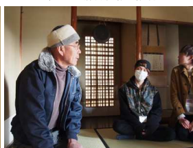
さくあん 萩野社長の説明