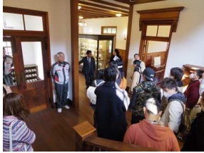
園内の旧田辺邸の見学