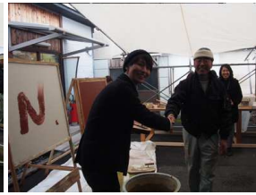
日大ロゴマーク 親方と学生