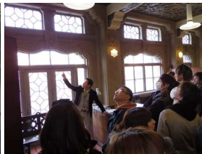
東華菜館 于社長による説明