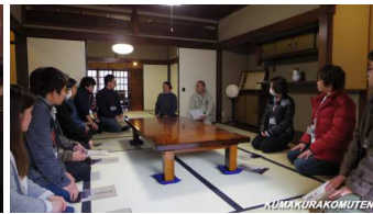
古賀所長・石原部長による内部概要説明