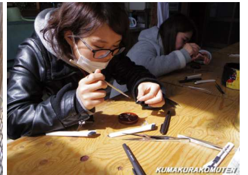
塗装の説明とキーホルダーの作成