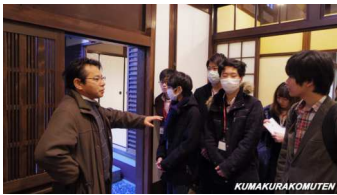
古賀座長による概要説明