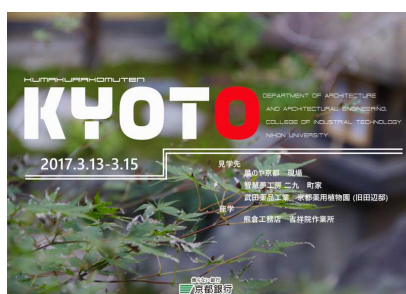
京都研修のロゴマーク