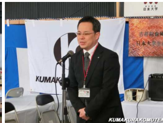
京都銀行 東山支店長 挨拶