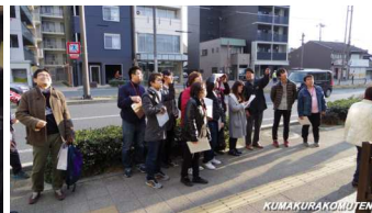
萩野氏による外部仕上の説明