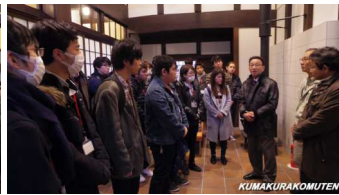
社長による概要説明