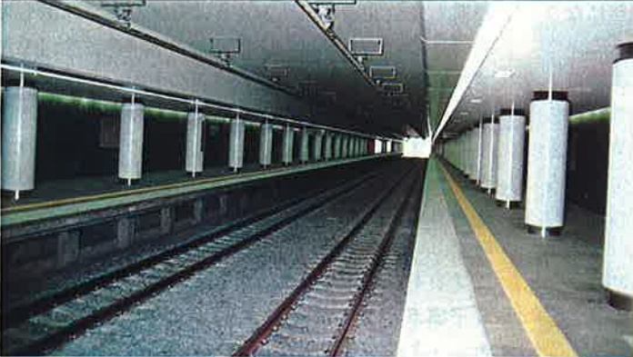
習志野校舎前に建設中の地下鉄駅舎と駅校内

阪神大震災に遭われた皆様に心よりお見舞いを申し上げ、 一刻も早い復興を祈念します