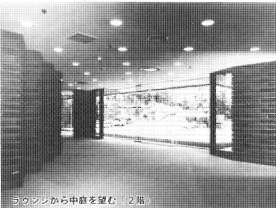
ラウンジから中庭を望む（2階）