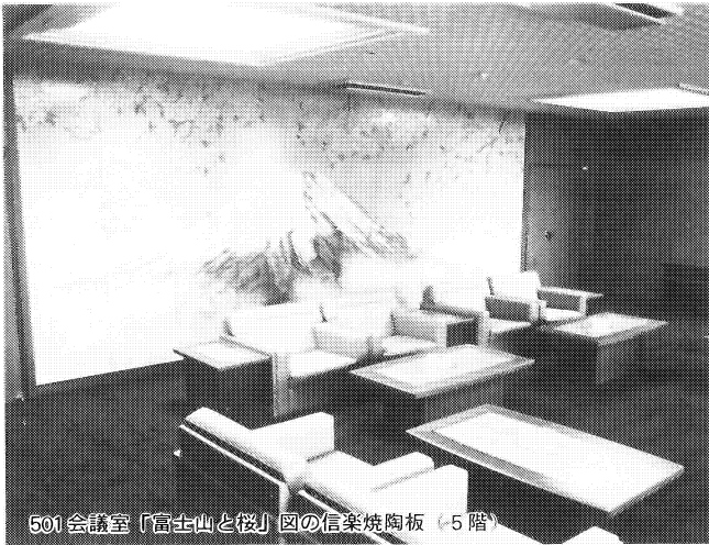
501会議室「富士山と桜」図の信楽焼陶板（5階）