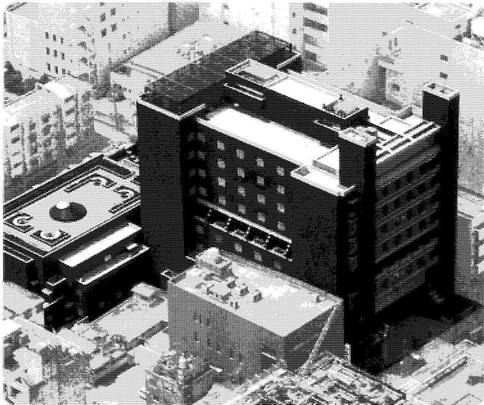
空から見た日本学会館全景